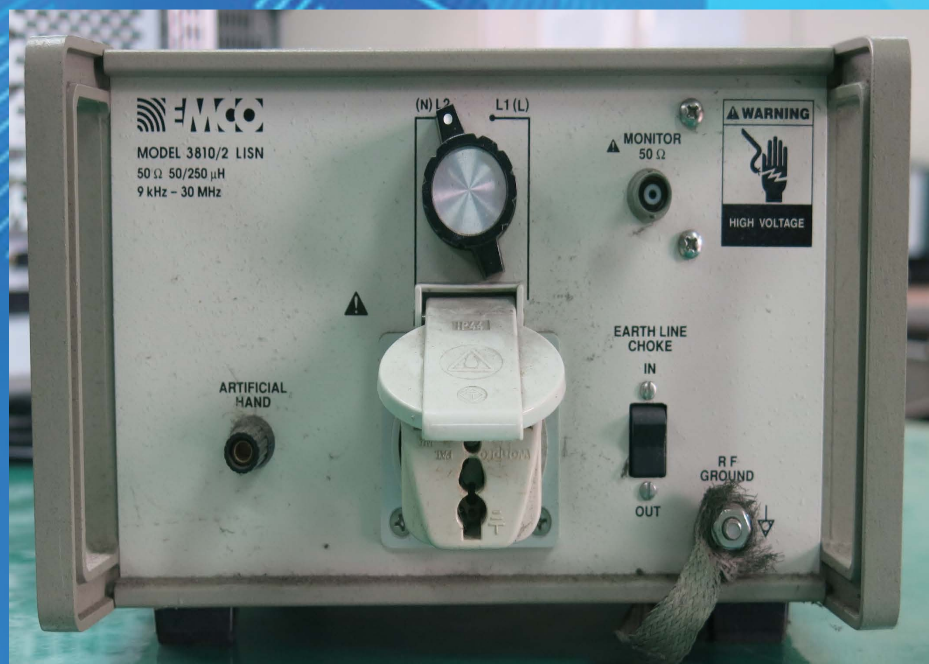
線性阻抗穩定網路